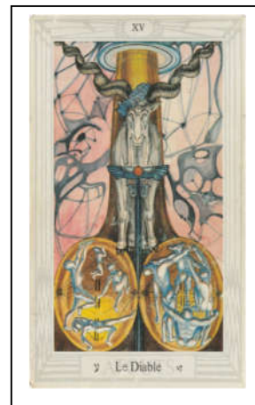
Tarot Thoth / Diable

Le diable est une invention du monothéisme et n'existait pas dans la « religion » de l'Égypte ancienne. Fez/Marseille : l'être humain est enchaîné. Thoth : la maîtrise de sa vie.