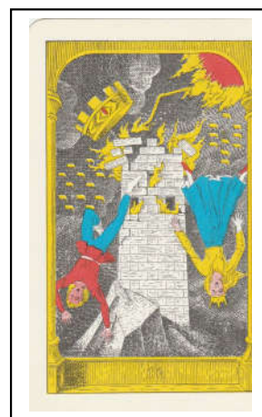
Tarot Fez / Tour

Le diable est une invention du monothéisme et n'existait pas dans la « religion » de l'Égypte ancienne. Fez/Marseille : l'être humain est enchaîné. Thoth : la maîtrise de sa vie.