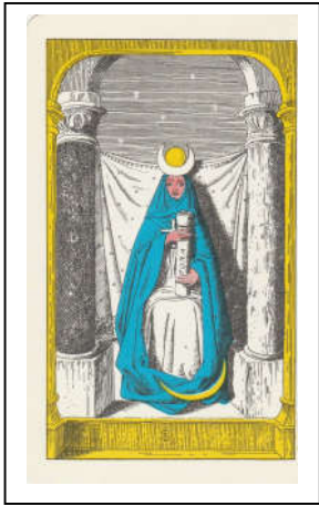
Tarot Fez / Papesse