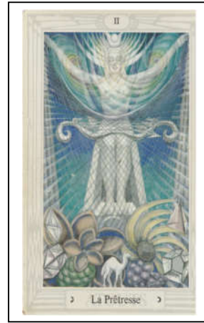
Tarot Thoth / Prêtresse

Il n'y a jamais eu une Papesse officielle ! Mais des Prêtresses !