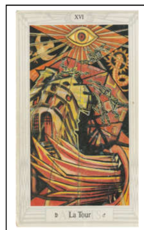
Tarot Thoth / Tour

Fez et Marseille : l'éclair, le feu, détruit la tour d'en haut donc intervention de l'extérieur (Dieu) / Toth : l'éclair, le feu, vient d'en bas donc intervention de son intérieur !