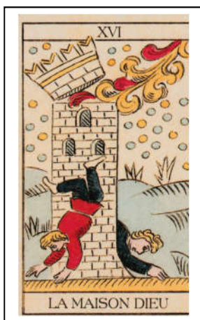
Tarot Marseille / Tour