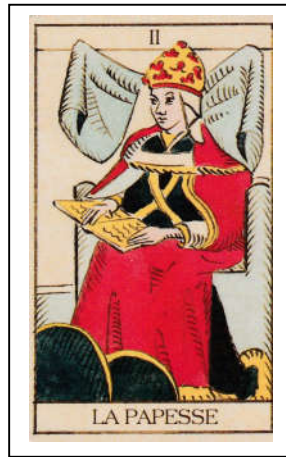
Tarot Marseille / Papesse